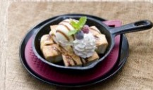
あっちっちハニートースト