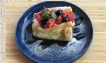
季節のシフォンケーキ